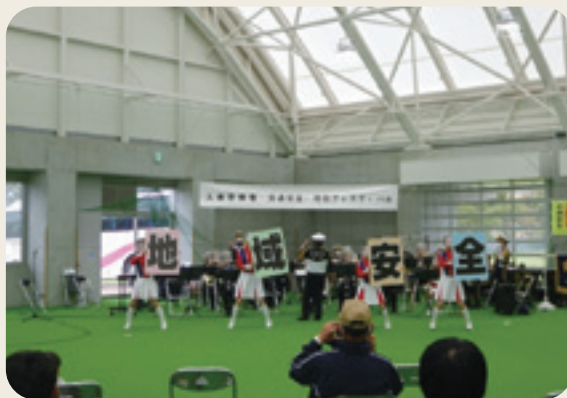
入善警察署交通安全・防犯フェスティバル 警察官による護身術教室 警察音楽隊による演奏会 各地区防犯パトロール隊、入善警察署、黒東防犯協会 (令和4年10月8日、屋内多目的施設わくわくドーム)