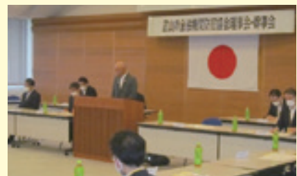
青木会長代理の挨拶

引き続き、研修会が行われ、県警担当者を招致し「富山県の犯罪情勢と犯罪抑止対策について」及び、「富山県の特種詐欺の現状と防止対策について」を聴講しました。