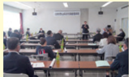
岩協理事長の挨拶

続いて、6月7日(水)には、岩瀬カナル会館において、令和5年度定時評議員会が開催され、令和4年度決算、評議員の辞任及び死去に伴う補欠選任(案)、理事及び監事の辞任に伴う補欠選任(案)等が承認されました。