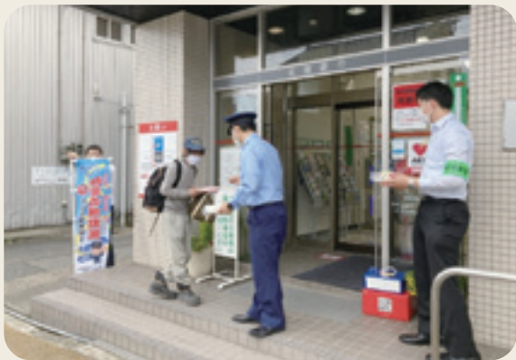
年金支給日における特殊詐欺被害防止活動 入善警察署、黒東防犯協会 (令和4年6月15日、北陸銀行入善支店)

連絡先 電話 0765-72-1100(代表) FAX 0765-74-0067