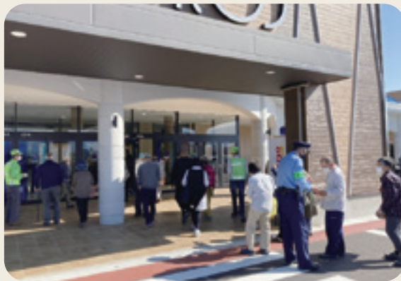
年金支給日における特殊詐欺被害防止活動 防犯パトロール隊、入善警察署、黒東防犯協会 (令和4年10月14日、入善ショッピングセンターコスモ21)