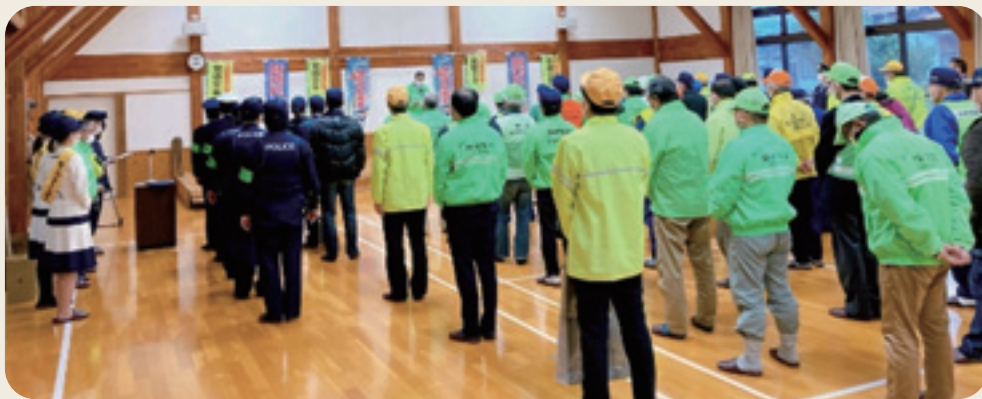
年末特別パトロール出発式 各地区防犯パトロール隊、少年補導員、入善警察署、黒東防犯協会 (令和4年12月2日、桐山公民館)