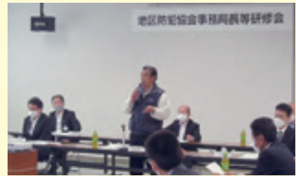
岩協理事長の挨拶

研修会では、警察本部犯罪抑止対策室課長補佐から「富山県の犯罪情勢と犯罪抑止対策について」の講話と、富山南防犯協会では「地区防犯協会の活動事例について」のDVDが上映され、防犯対策等について研修しました。