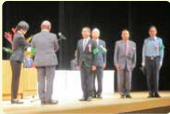
県知事表彰授与の様子

10月6日(月)富山県民会館において、当協会、県、県警察主催で、県民の防犯意識の高揚を目的とした「第21回富山県安全なまちづくり推進大会・第32回全国地域安全運動富山県民大会」が開催され、約500人が参加しました。