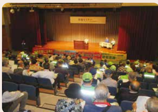
防犯セミナー 富山南防犯協会 (令和7年10月17日、大久保ふれあいセンター)