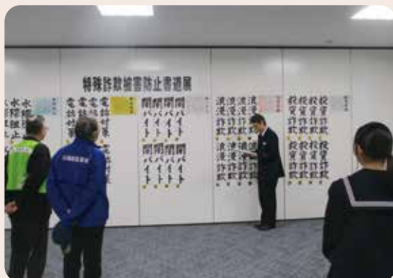
特殊詐欺被害防止書道展(上滝中学校) 富山南警察署、富山南防犯協会、上滝地区防犯組合 (令和7年1月21日、富山南警察署)