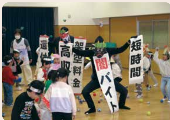
特殊詐欺被害防止節分行事(新保なかよし認定こども園) 富山南警察署、富山南防犯協会、新保校区防犯環境協議会 (令和7年1月31日、新保なかよし認定こども園)