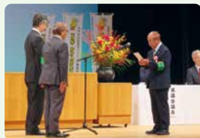
受章者代表の謝辞