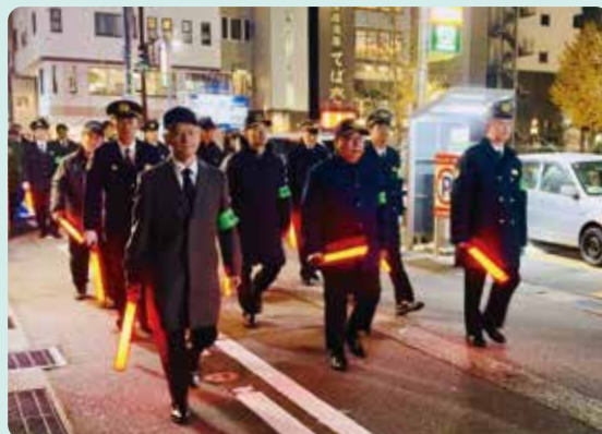
出発式と合同パトロールの様子