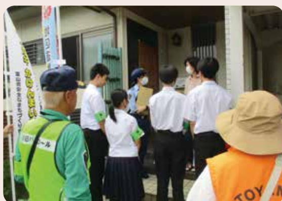
特殊詐欺被害防止高齢者宅訪問(興南中学校) 富山南警察署、富山南防犯協会、熊野校下防犯組合連合会 (令和7年7月1日、熊野校下高齢者宅)