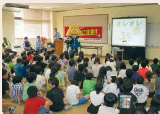
特殊詐欺撲滅メッセージ大作戦(大沢野小学校) 大沢野地区防犯組合、富山南防犯協会、富山南警察署 (令和7年7月18日、大沢野小学校)