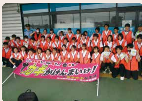
カギかけキャンペーン(大沢野中学校) 大沢野地区防犯組合、富山南防犯協会、富山南警察署 (令和7年7月1日、グリーンバレー大沢野)